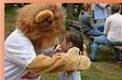
Leo kommt zu Besuch