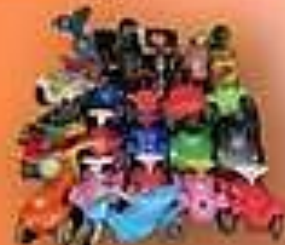
Bobbycarparcour & Kinderrallye