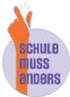
Schule muss anders